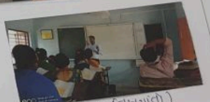
(આયોજિત કોલેજમાં વિદ્યાર્થીઓ)