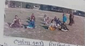
આમના મારી વિદ્યાર્થીઓને આમુચમ બસીને યાગા કર્યા હતા ત્યારબાદ ડીલા રાઇને યાગા કર્યા હતા.

ત્યારબાદ લાલીમાર્થી બલને રોસ આવાચારવિદી કરવામા આવી હતી અને માર્કિમ આમાલ કુલામા આવાચારવો